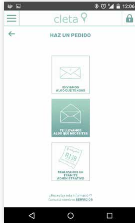
ELIGE EL SERVICIO QUE QUIERES

Realiza tus envíos y gestiones en cinco pasos: