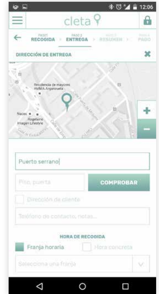
INTRODUCE DIRECCIÓN DE ENTREGA Y/O GESTIÓN