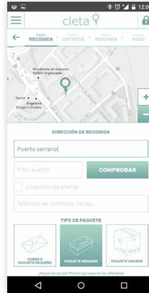
INTRODUCE DIRECCIÓN DE RECOGIDA